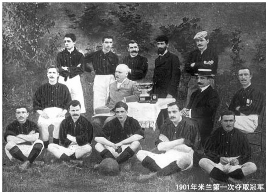
1901年米兰第一次夺取冠军

随后的一个赛季，热那亚队对米兰队进行了报复行动，他们在最后的决赛里以2:0获胜，米兰队没有机会取得卫冕的机会，他们因此也非常的沮丧，过了五年，他们才有机会再次成为冠军的得主。但在1902年开始，这个盎格鲁血统的俱乐部开始允许其他国家的队员加入，其中还包括瑞士的球员。