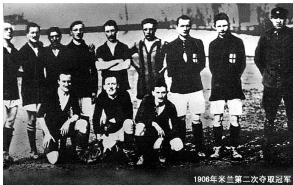
1906年米兰第二次夺取冠军