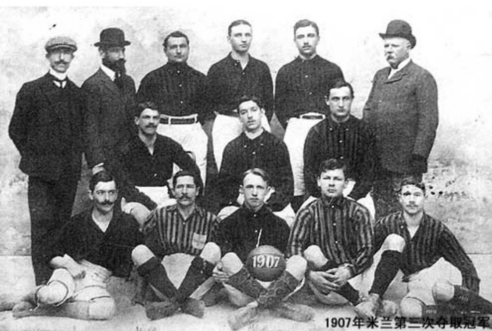
1907年米兰第二次夺取冠军