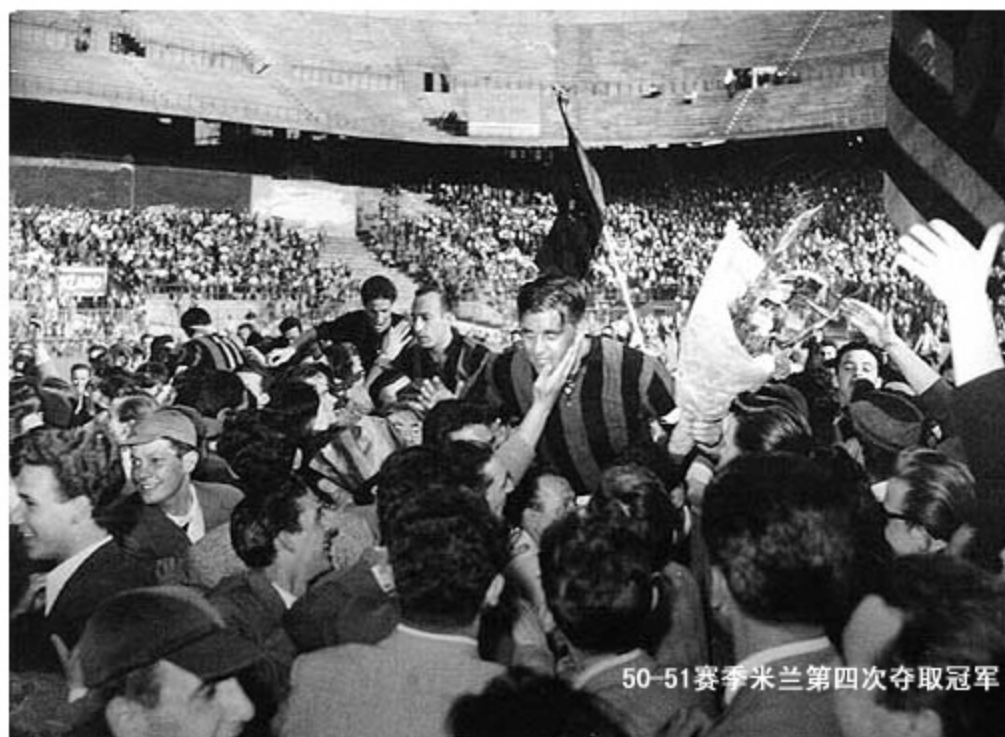
50-51赛季米兰第四次夺取冠军

本赛季头九场比赛包括6比2战胜乌迪内斯队，9比2战胜诺瓦拉队以及5比3战胜那不勒斯队，在这九场比赛里，米兰队没有失败，取得了7胜2平的优异成绩，给球队打下很好的开局。不过在和老对头国际米兰队的较量中，米兰队受到了对手顽强的反击，结果是以2：3失败，这次失败给米兰队很大打击，外界也认定米兰队一定会好像上赛季一样再次在最后关头失败的。然而，经过了这次失败，米兰队上下反而更加坚定了进攻是最好的防守这一道理，在和国际队的比赛里，米兰队恰恰是慑于上赛季败给国际队的心理阴影，结果是没有打开胜利局面，输得非常窝囊。匈牙利教练塞吉勒在一次动员会上特别强调米兰队在过去几轮比赛里的优势和稳定的战术套路，坚定了以瑞典球星为核心的打法，全队在它的动员下众志成城，随后又取得了一连串的胜利，后来也有媒介认为，如果在这个赛季米兰队最终没有取得冠军，那他们恐怕又要花费很长的时间来取得成功，因为失败给国际米兰队，AC米兰队好像泄气的皮球，正是塞吉勒的英明决策，扭转了局势，保证了没有迷失方向。