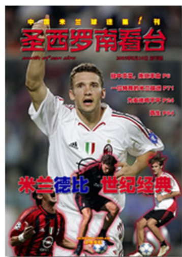
《圣西罗南看台》杂志 2005年8月号 创刊号