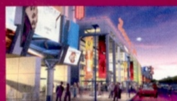
商业步行街效果图