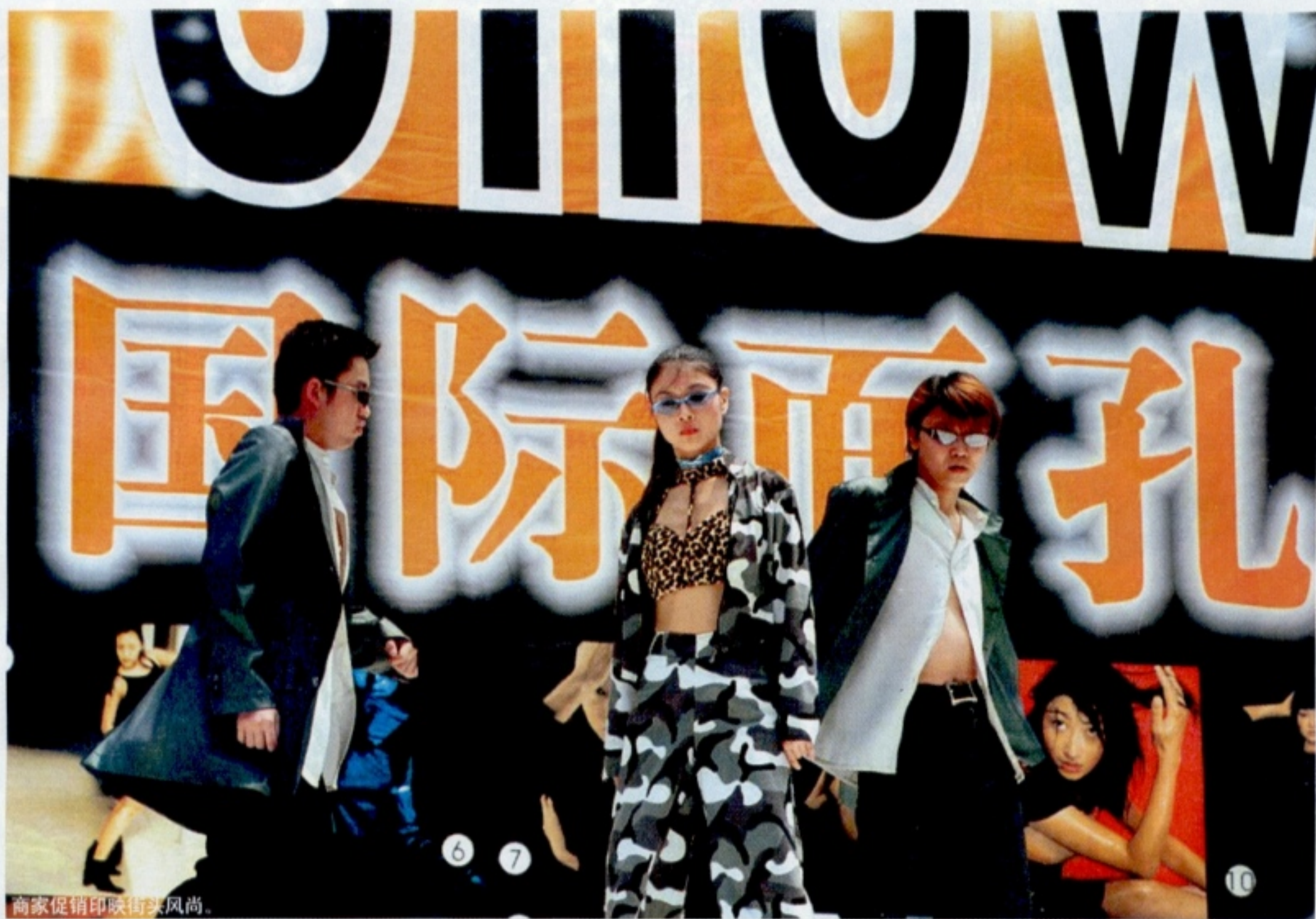
商家促销印映街头风尚。