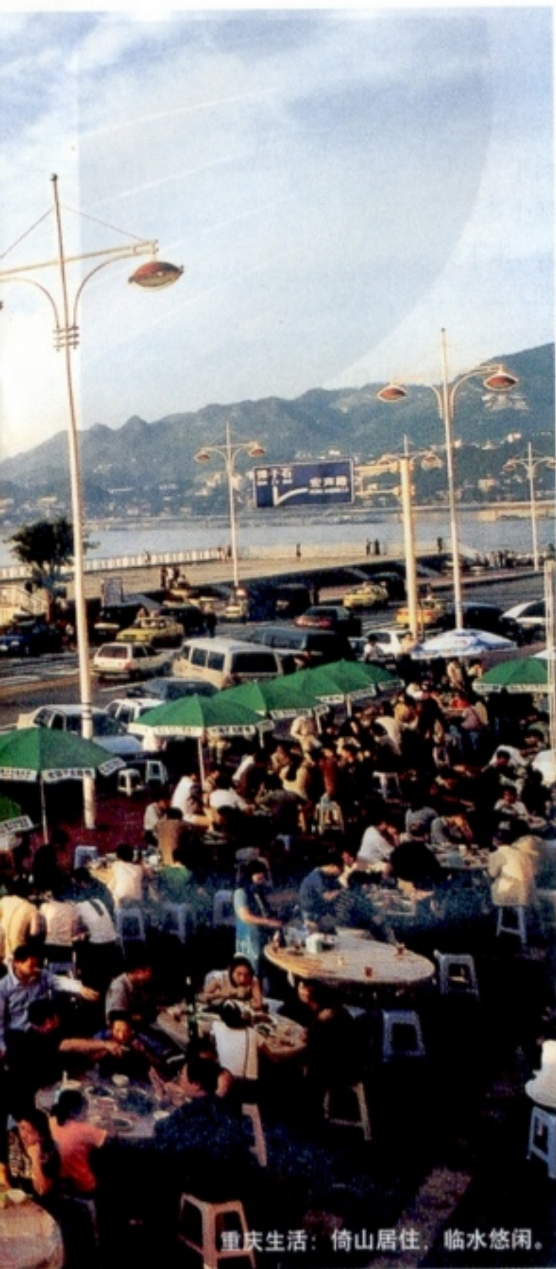
重庆生活：倚山居住，临水悠闲。